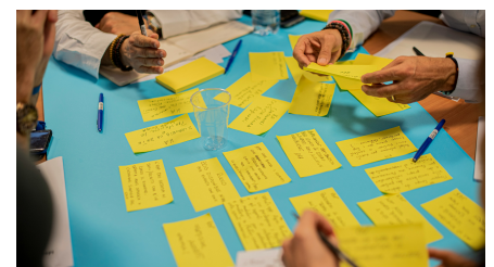
Basel-Stadt: Programm zur Prävention von Einsamkeit

sönliche Lebensumstände wie chronische Erkrankungen oder traumatische Erlebnisse greifen ineinander. Dies heisst im Umkehrschluss, dass auch die Reduktion von Einsamkeit vielschichtig und anspruchsvoll ist.